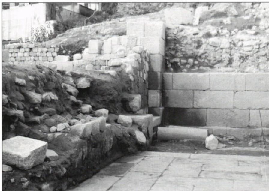
Fig. 9 – Pormenor do aditus limitado à esquerda pelo muro do proascaenium .