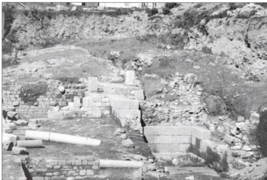
Fig. 8 – Perspectiva geral da área escavada em 2006.

O muro do proscænium revelou-se recortado, sendo de destacar que apresentava restos de argamassas em quase toda a extensão descoberta, sobre as quais assentava a pintura a fresco, que revestiria todo o muro, como tivemos oportunidade de documentar através de alguns sectores de pintura conservados. Tanto quanto é possível admitir pelos restos de argamassas detectadas na parede poente do aditus esta seria igualmente decorada com pinturas. No muro do proscænium foi ainda identificada uma saída de água que ligaria a uma das cloacas que se situam no limite do terreno.