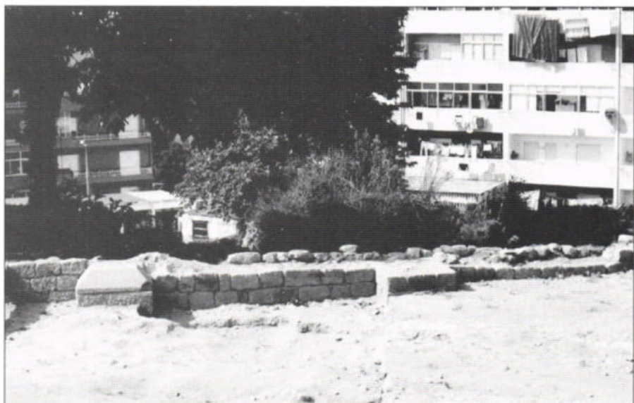
Fig. 6 – Perspectiva do muro perimetral na plataforma superior.

A partir da campanha de 2005 pudemos finalmente começar a trabalhar em duas frentes. Uma delas continuou a ser a plataforma superior onde corre o muro perimetral, tendo em vista compreender a envolvente do teatro, pelo que foi posta a descoberto uma extensa área, cujo estudo ainda não se encontra concluído.