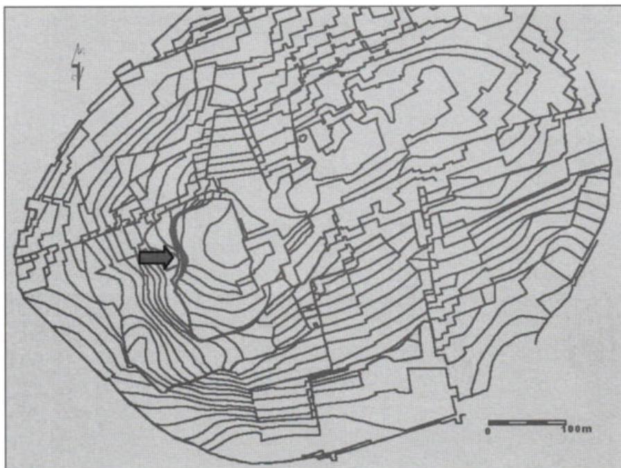
Fig. 4 – Localização do teatro na planta de Francisco Goullard.

Curiosamente existe dele uma memória cartográfica que não foi devidamente valorizada senão após a sua identificação arqueológica. De facto, a análise atenta da planta de Braga, da autoria do engenheiro Francisco Goullard, elaborada em 1883-84, permite observar uma inusitada concentração de curvas de nível no local que hoje corresponde aos limites da plataforma superior do Alto da Cividade. Efectivamente, aquelas curvas de nível correspondem a uma fossilização do que seria o declive da cavea superior do teatro, também registada na fotografia aérea mais antiga que dispomos para Braga, datada de 1946, conforme pudemos demonstrar pela projecção do edifício que vem sendo posto a descoberto nos últimos anos.