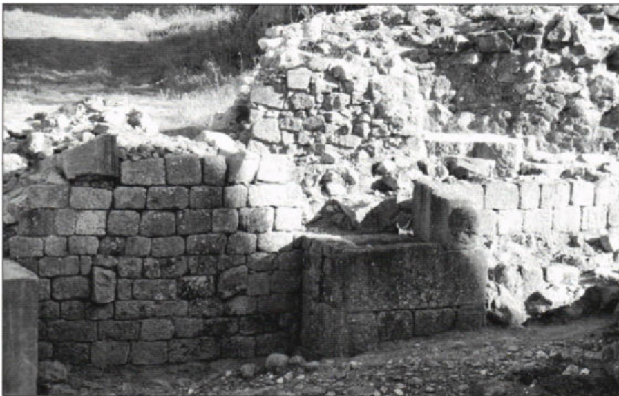
Fig. 5 – Perspectiva do muro perimetral do teatro detectado em 1999.

A identificação em 1999 de parte do muro perimetral do teatro, situado no limite noroeste da palestra das termas, permitiu desde logo analisar algumas das suas características construtivas. De facto, estávamos perante um muro com cerca de 4m de largura, limitado por dois paramentos, com um miolo composto por um poderoso enchimento de pedras e argamassa.