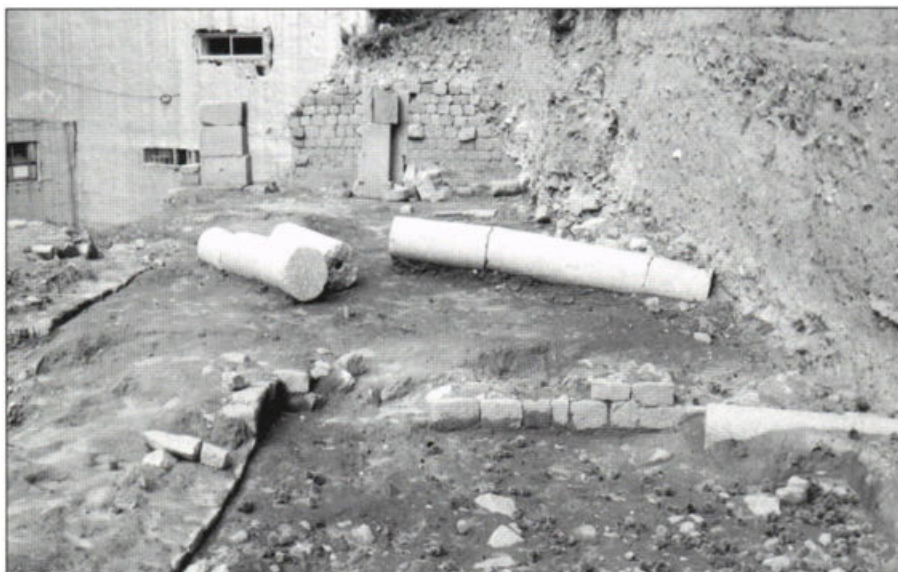
Fig. 7 – Perspectiva dos vestígios descobertos em 2005, correspondentes à scaena do teatro.

Tendo em conta os resultados obtidos, tornava-se absolutamente necessário desmontar o referido muro e remover cerca de 4m de aterros, trabalho que só veio a ser realizado na campanha de 2006.