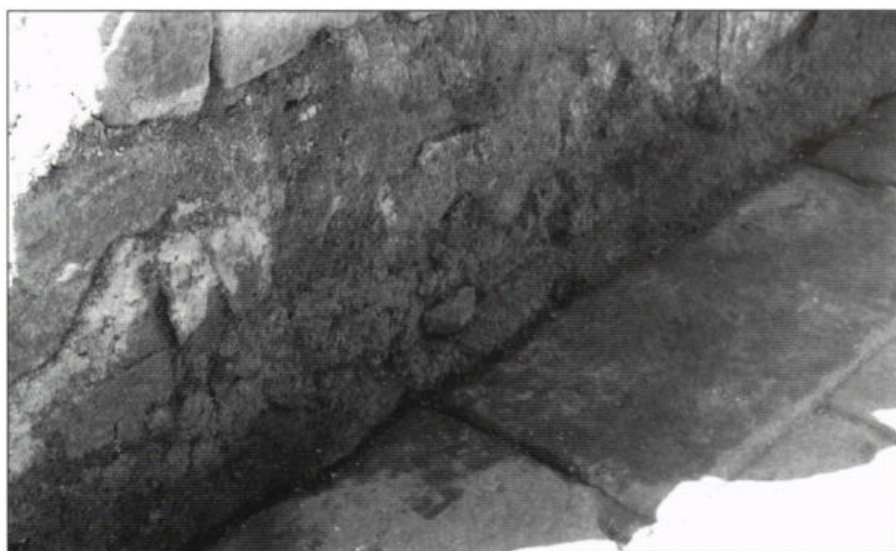
Fig. 10 – Pormenor de restos da pintura que ornamentava o muro do proascaenium .