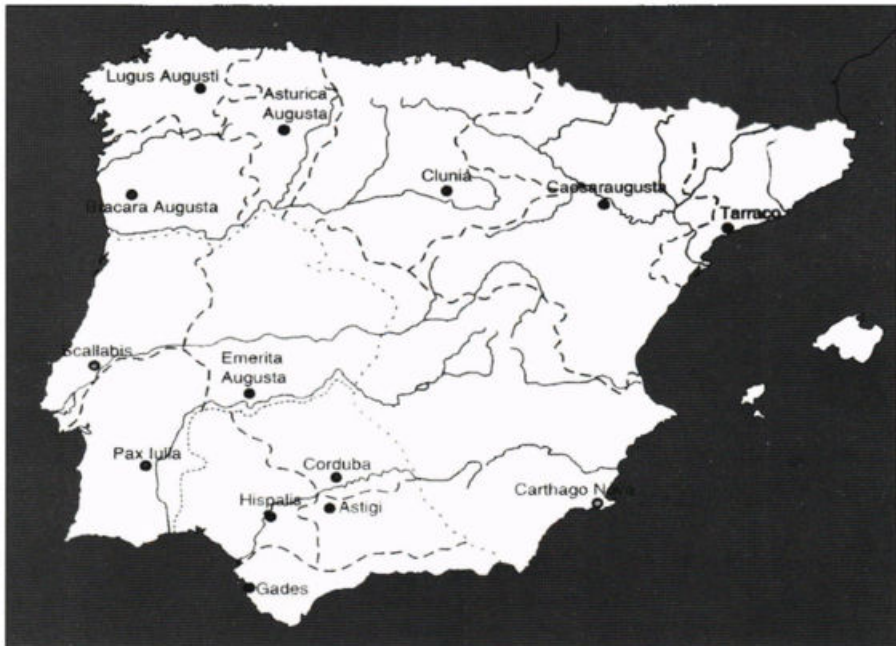
Fig. 1 – Mapa da Península Ibérica com localização das províncias e convento.

Esta descoberta teve um enorme alcance científico, pois o reconhecimento de um traçado ortogonal em Bracara Augusta , de raiz fundacional, permitia pensá-la e situá-la no contexto mais amplo do urbanismo romano peninsular, designadamente, no âmbito da política de fundações augústeas na Hispânia, ao lado de Emerita , Caesaraugusta , Asturica ou Lucus Augusti (Martins 1999a; 1999b). Por outro lado, a demonstração de um traçado ortogonal na cidade romana teve uma enorme transcendência para a continuidade da sua investigação arqueológica, pois passámos a dispor de um modelo instrumental que permitia encaixar os vestígios conhecidos e os que iam sendo descobertos numa matriz urbana e a conseguir prever que tipo de construções e equipamentos podiam vir a ser detectados nas intervenções que, desde então, passaram a ser realizadas.