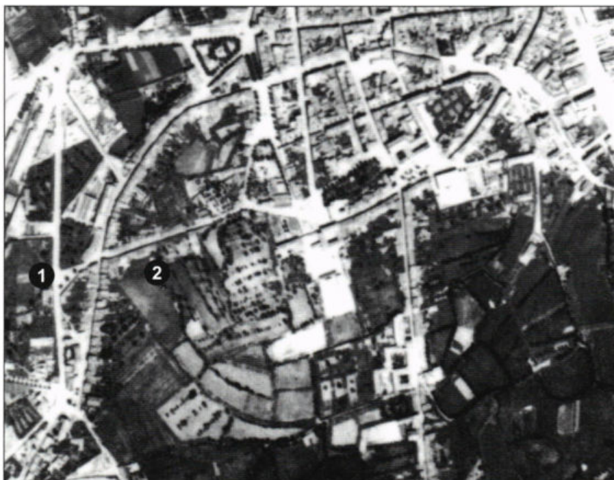
Fig. 3 – Localização do anfiteatro (1) e do teatro (2).

Embora não se registem mais referências ao anfiteatro, posteriormente ao século XIX, pensamos que a memória escrita das suas ruínas, bem como os indícios propiciados pela análise da fotografia aérea de Braga, valorizados por Rui Morais (2001), representam, em conjunto, um poderoso testemunho da sua existência, que aguarda uma oportunidade de ser confirmada arqueologicamente.