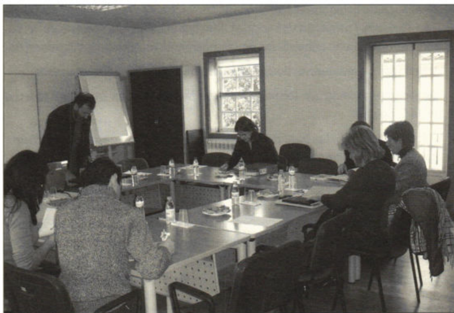
Equipa do Projecto na reunião de 2 de Março de 2006.

Com a realização do estudo procurar-se-á garantir a descrição e a compreensão em profundidade da actividade desenvolvida pela ATHACA ao nível da concepção e desenvolvimento de Cursos EFA, durante o período em análise, instituindo-se como objectos de estudo toda a documentação produzida no âmbito do Centro, as práticas de formação desenvolvidas e os efeitos dessa formação, estes últimos perspectivados através da representação dos actores directamente envolvidos – responsáveis da Associação, formadores e formandos e dos empregadores.