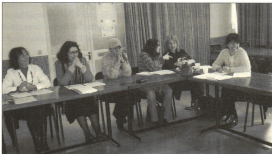
Elementos do Grupo Externo, na reunião de 22 de Março de 2006.

lectivas ou pedagógicas diversas. Os dados obtidos favoreceram a redacção de dois documentos que integraram o Guia de Experiências Inovadoras, apresentado na III Reunião do Grupo Externo do Projecto a 22 de Março de 2006, na qual esta fase foi discutida e validados os resultados obtidos.