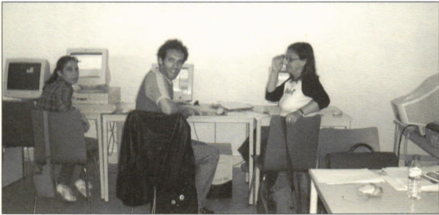
Formandos de Cursos de Educação e Formação de Adultos (Guimarães, Junho de 2006).

Deste modo, com estes objectivos foram efectuadas entrevistas a professores e alunos, e foram realizadas diversas sessões de observação a acções de educação extra-escolar e do ensino básico recorrente, bem como de formação dos Cursos de Educação e Formação de Adultos, numa associação de desenvolvimento local.