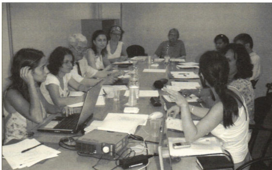
Elementos das Equipas de Investigação do projecto YOUTRAIN em Barcelona, no dia 18 de Junho de 2006.