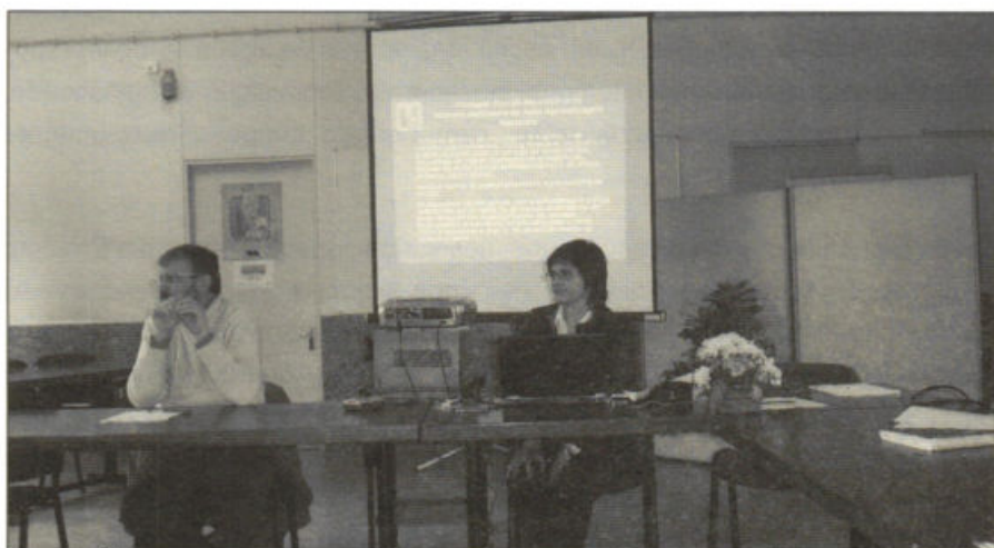
Elementos do Grupo Externo, na reunião de 22 de Março de 2006.