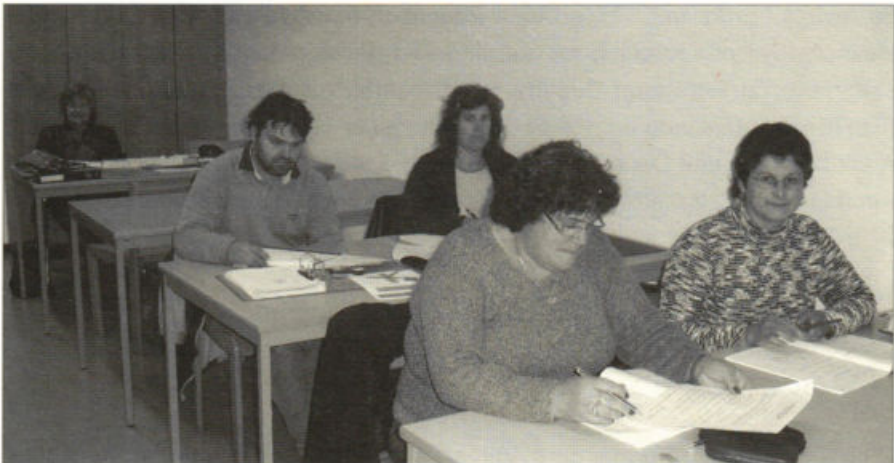
Alunos do Ensino Básico Recorrente 1.º ciclo (Lousada, Maio de 2006).