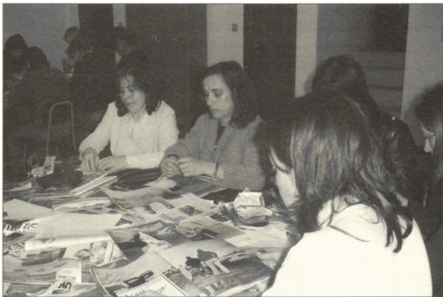
Formandos de um Curso de Educação Extra-Escolar (Vermoim, Maio de 2006).

Os dados recolhidos possibilitaram a elaboração de dois relatórios da autoria de Rui Vieira de Castro, Amélia Vitória Sancho e Paula Guimarães, "Educação de Adultos em Portugal: Modos de pensar e modos de fazer", em publicação na revista Forum (n.º 39), e "Adult Education Initiatives: Different scenarios; distinct ways of searching for learning and development?", a apresentar no seminário da European Society for Research on the Education of Adults (ESREA), organizado pela rede de investigação "Between Local and Global: Adult Learning and Development" que, sob o tema "Human Development and Adult Learning", decorrerá na Universidade do Algarve, em Faro, nos dias 20, 21 e 22 de Outubro de 2006.