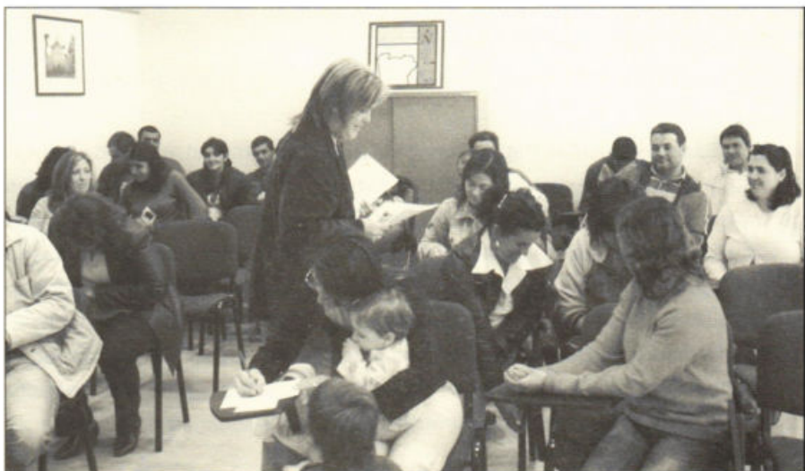
Participantes numa acção de sensibilização levada a cabo pela Coordenação Concelhia do Ensino Recorrente e Educação Extra-escolar de Famalicão no Centro de Emprego de Famalicão (Maio de 2005).