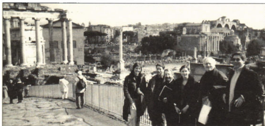
Elementos do Steering Committee da ESREA (Roma – Itália, 5 de Março de 2005).

A UEA, a convite da ESREA, é elemento do seu Steering Committee por um período de três anos (2005-2008).