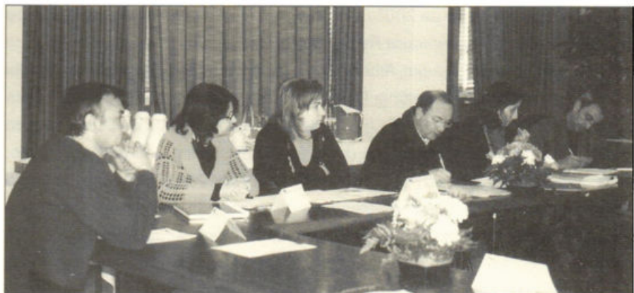
Grupo de Trabalho Nacional (Universidade do Minho, 5 de Março de 2005).