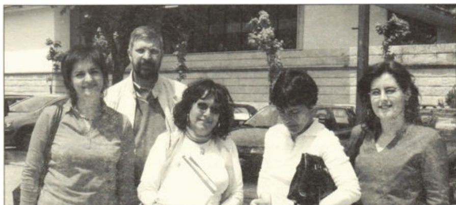
A Equipa de Investigação do projecto YOUTRAIN (Universidade do Minho, 19 de Maio de 2005).

O trabalho realizado pela Equipa de Investigação, que se reuniu em diversas ocasiões ao longo deste primeiro semestre, conduziu à elaboração do "Relatório Nacional – PORTUGAL. A Qualidade dos Sistemas de Educação Obrigatória e Pós-Obrigatória e as Novas Necessidades Educativas dos Alunos".