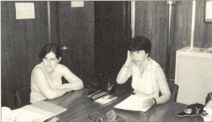
A Equipa de Investigação do projecto YOUTRAIN (Universidade do Minho, 22 de Junho de 2005).