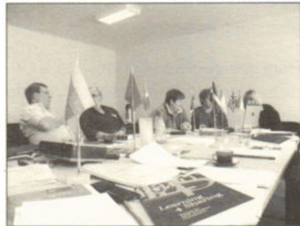
Grupo Coordenador do projecto AGADE ( Vilnius – Lituânia, Abril de 2005).