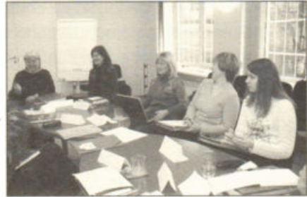
Grupo Coordenador do projecto AGADE (Tallinn – Estónia, Janeiro de 2005).