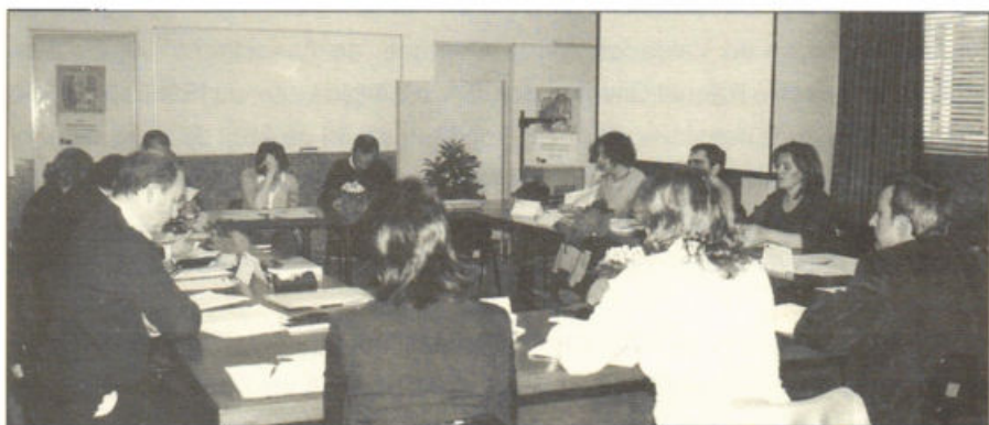
Grupo de Trabalho Nacional (Universidade do Minho, 12 de Abril de 2005).