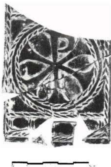
Fig. 5 – Placa de azeviche negro com a gravação do crismon , recom nível habitacional do séc. V/VI em escavações na rua do Anjo.