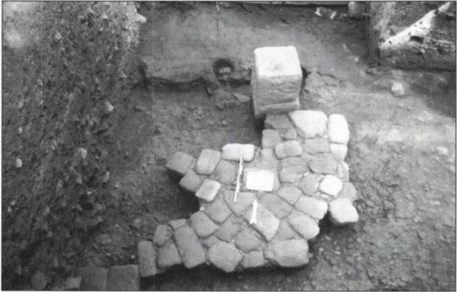
Fig. 2 – Escavações no interior da cerca do Seminário de Santiago: rua lageada e pilar de pórtico do Baixo Império.